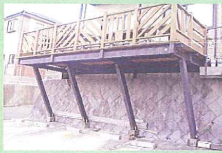
バルコニー支柱部分に塗布

～長崎県 佐世保市～ 『ヘルスコ・キュアー』が塗布され7年が経過した住宅のバルコニーの支柱です。長い月日を経ても、塗膜面もしっかりしており、木材部の腐食もありません。