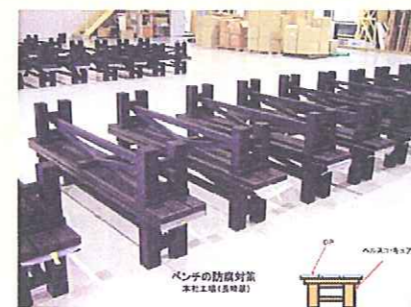
ベンチの防腐対策

上部のマリン専用ペイントは、同日に塗ったのですが、2年の経過で塗膜が剥離してきています。それに比べ『ヘルスコ・キュアー』の塗膜面は剥離も無く、木部を完全に保護しています。