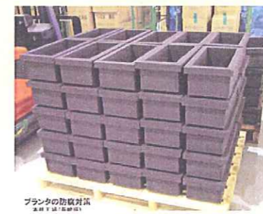
プランタの防腐対策