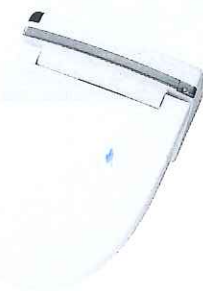
シャワートイレ・便座