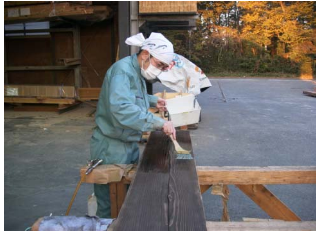
塗装 天然塗料を表面に塗布します