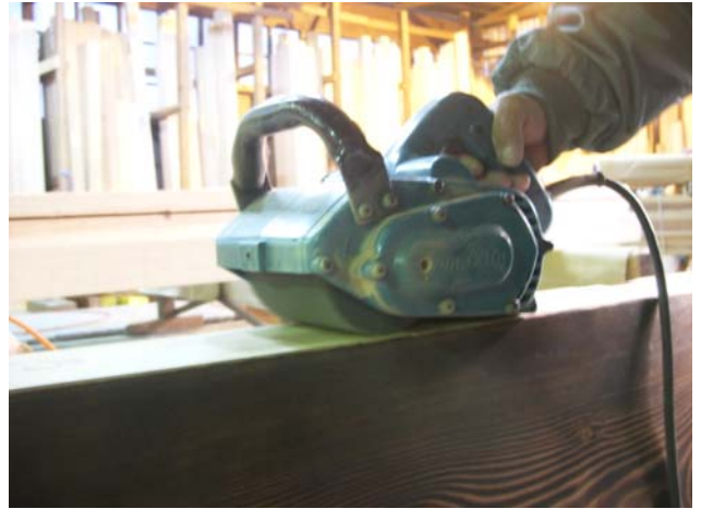
削り 専用の工具により早材部分を削り取ります