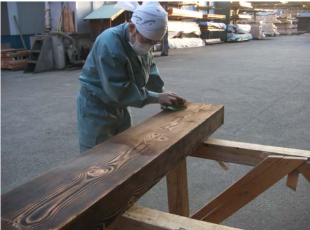
洗い タワシで残った焦げかすを丁寧に洗って、 木目を浮き立たせます