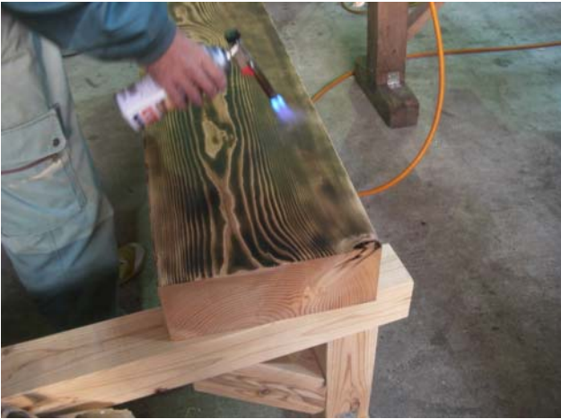
焦がし バーナーを用いて、均等に表面を焦がしていきます