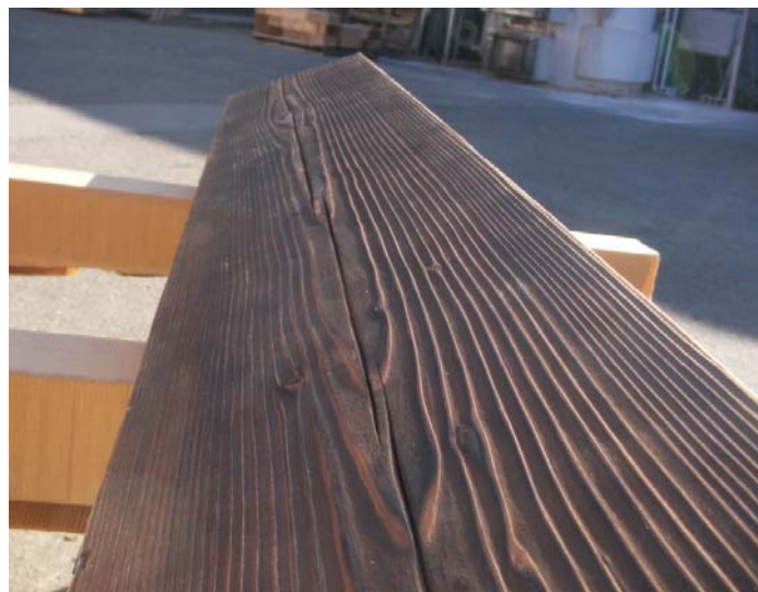
洗い出しによる焼き入れ 杉KD材