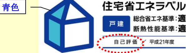
青色の住宅省エネラベル

住宅省エネラベリング制度とは、「住宅事業建築主の判断基準」に適合している住宅について、住宅省エネラベル(下図参照)を広告やパンフレット等に表示することができる制度です。住宅省エネラベルには、自主評価に基づく青色のラベルと第三者評価に基づく緑色のラベルがあります。第三者評価に基づく緑色のラベルを表示するためには、登録建築物調査機関※1に「住宅事業建築主判断基準に係る適合証」(以下、「適合証」といいます。)の交付申請を行い、登録建築物調査機関から「適合証」の交付を受ける必要があります。この「適合証」の交付を受けた住宅は、省エネルギー性の基準を満たす住宅※2として【フラット35】S(20年金利引下げタイプ)を利用することができます。