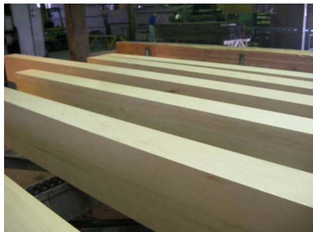
自動4面プレーナ後