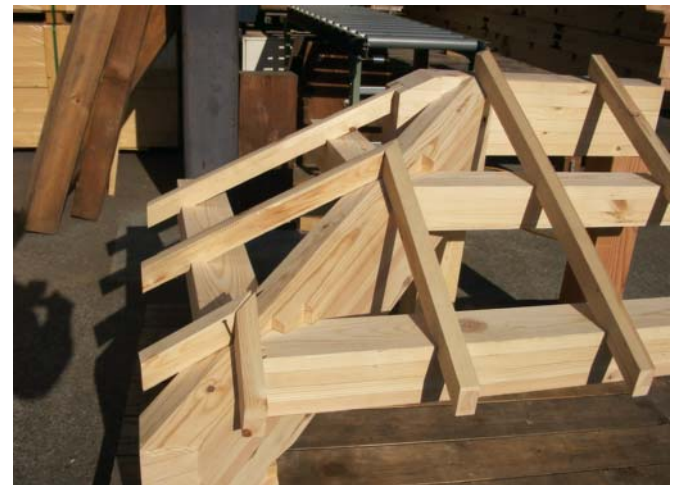
隅木レベルを下げて垂木を隅木の上端で納める方法です。