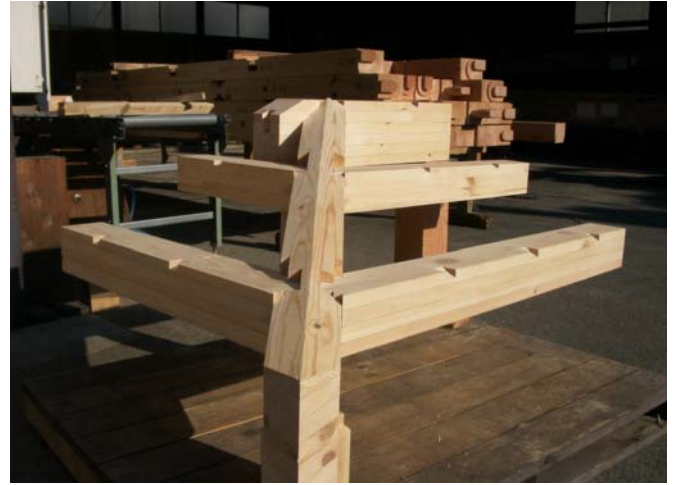
棟木を大きくして登り隅木を蟻掛けにする加工です。