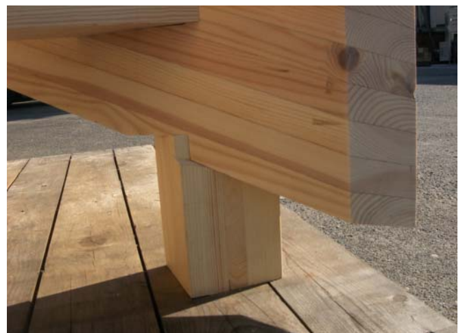
柱に直接登り隅木をのせ、隅木に小屋桁をのせます。（隅木のケラバ落とし出来ます）